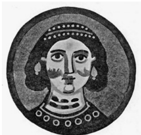
Сл. 3. Бавит, Капела III, представа врлине у медаљону, VI-VII век (СЛÉДАТ 1904, 23, fig. 18)